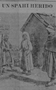
UN SPASHI HERIDO. El spashi que aparece en el grabado, fué herido en las trincheras, y en la balala le alendzó la mano. Vuelto a la retaguardia, se hace colocar la primera ligadura, lo cual le causa veridada desazón, pues para un spashi la lucha encarnizada y heroica es el elemento de la vida, así como lo es el agua para el pez. Pero considera si desde el momento en que no ha sido herido a caballo, no debe sentirse ofendido en su amor propio y así se resuelve a esperar pacientemente que la Cruz Roja le devuelva sano a sus funciones, para poder participar en las nuevas cargas gloriosas con las cuales coopera decididamente en la victoria de Francia y de sus aliados.

ESTOKOLMO, 26.—Los norteamericanos hacen esfuerzos para mantener su comercio con Suecia. El aumento que blanizó en 1915 se disminuyó considerablemente, a causa del bloqueo y los reglamentos del comercio sueco. Durante el primer trimestre de 1916 ascendió a 123,350 dólares contra 41,943,001 en 1915.